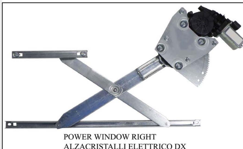
POWER WINDOW RIGHT ALZACRISTALLI ELETTRICO DX

THIS INSTALLATION INSTRUCTION IS FOR BOTH LEFT AND RIGHT SIDE. CETTE INSTRUCTION DE MONTAGE EST POUR LES DEUX COTES DROIT ET GAUCHE. DIESE MONTAGE-ANLEITUNG IST FÜR DIE BEIDE LINKE UND RECHTE SEITE. ESTA INSTRUCCION DE MONTAJE ES PARA LOS DOS LADOS IZQUIERDO Y DERECHO. ESTAS INSTRUÇÕES VALEM TANTO PARA O LADO ESQUERDO QUANTO PARA O DIREITO. LA PRESENTE ISTRUZIONE VALE SIA PER IL LATO SINISTRO CHE PER IL LATO DESTRO.