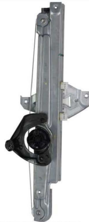
ORIGINAL POWER WINDOW RIGHT ALZACRISTALLI ELETTRICO ORIGINALE DX

THIS INSTALLATION INSTRUCTION IS FOR BOTH LEFT AND RIGHT SIDE. CETTE INSTRUCTION DE MONTAGE EST POUR LES DEUX COTES DROIT ET GAUCHE. DIESE MONTAGE-ANLEITUNG ISTFÜR DIE BEIDE LINKE UND RECHTE SEITE. ESTA INSTRUCCION DE MONTAJE ES PARA LOS DOS LADOS IZQUIERDO Y DERECHO. ESTAS INSTRUÇÕES VALEM TANTO PARA O LADO ESQUERDO QUANTO PARA O DIREITO. LA PRESENTE ISTRUZIONE VALE SIA PER IL LATO SINISTRO CHE PER IL LATO DESTRO.