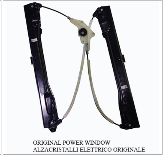
ORIGINAL POWER WINDOW ALZACRISTALLI ELETTRICO ORIGINALE