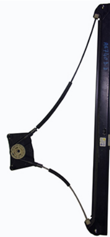
ORIGINAL POWER WINDOW ALZACRISTALLI ELTTRICO ORIGINALE