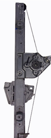
ORIGINAL POWER WINDOW LIFTER ALZACRISTALLI ELETTRICO ORIGINALE SX