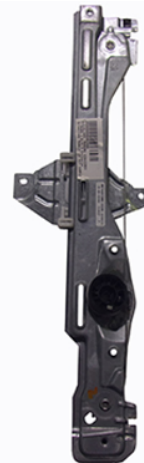
ORIGINAL POWER WINDOW ALZCRISTALLI ELETTRICO ORIGINALE