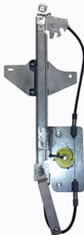
POWER WINDOW LEFT ALZCRISTALLI ELETTRICO SX

Citroën C-ELYSEE (DD_) (2012>) MECHANISM LH 9674437380* RH 9674437280*