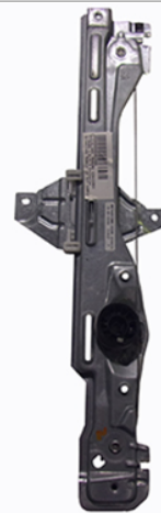
ORIGINAL POWER WINDOW ALZCRISTALLI ELETTRICO ORIGINALE