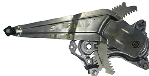
ORIGINAL POWER WINDOW LIFTER ALZACRISTALLI ELETTRICO ORIGINALE