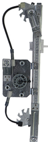
POWER WINDOW LIFTER ALZACRISTALLI ELTRICO

THIS INSTALLATION INSTRUCTION IS FOR BOTH LEFT AND RIGHT SIDE. CETTE INSTRUCTION DE MONTAGE EST POUR LES DEUX COTES DROIT ET GAUCHE. DIESE MONTAGE-ANLEITUNG IST FÜR DIE BEIDE LINKE UND RECHTE SEITE. ESTA INSTRUCCION DE MONTAJE ES PARA LOS DOS LADOS IZQUIERDO Y DERECHO. ESTAS INSTRUÇÕES VALEM TANTO PARA O LADO ESQUERDO QUANTO PARA O DIREITO. DEZE AANWIJZINGEN GELDEN VOOR ZOWEL DE LINKER- ALS DE RECHTERKANT. Η ΠΑΡΟΥΣΑ ΟΔΗΓΙΑ ΑΦΟΡΑ ΤΟΣΟ ΤΗΝ ΑΡΙΣΤΕΡΗ ΟΣΟ ΚΑΙ ΤΗ ΔΕΞΙΑ ΠΛΕΥΡΑ. LA PRESENTE ISTRUZIONE VALE SIA PER IL LATO SINISTRO CHE PER IL LATO DESTRO.