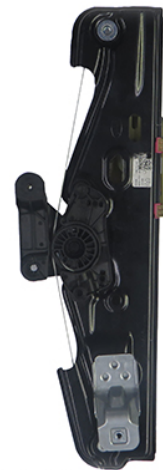
ORIGINAL POWER WINDOW LIFTER ALZACRISTALLI ELETTRICO ORIGINALE