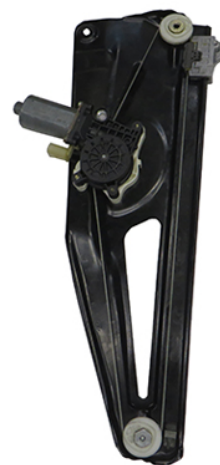
ORIGINAL POWER WINDOW LEFT ALZACRISTALLO ELETTRICO ORIGINALE SX