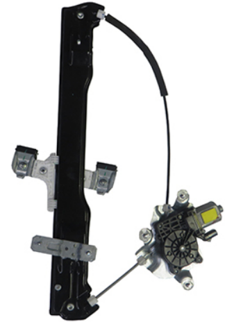
ORIGINAL POWER WINDOW RIGHT ALZACRISTALLI ELETTRICO ORIGINALE DX