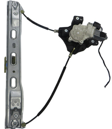
ORIGINAL POWER WINDOW RIGHT ALZACRISTALLI ELETTRICXO ORIGINALE DX