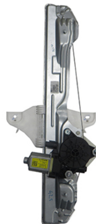
ORIGINAL POWER WINDOW LEFT ALZACRISTALLI LETTRICO ORIGINALE SX