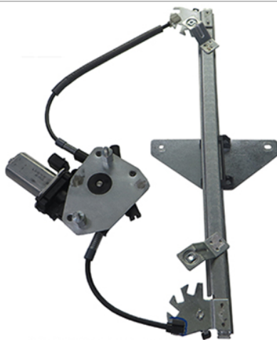
POWR WINDOW LEFT ALZACRISTALLI LETTRICO SX

THIS INSTALLATION INSTRUCTION IS FOR BOTH LEFT AND RIGHT SIDE. CETTE INSTRUCTION DE MONTAGE EST POUR LES DEUX COTES DROIT ET GAUCHE. DIESE MONTAGE-ANLEITUNG IST FÜR DIE BEIDE LINKE UND RECHTE SEITE. ESTA INSTRUCCION DE MONTAJE ES PARA LOS DOS LADOS IZQUIERDO Y DERECHO. AS PRESENTES INSTRUÇÕES VALEM TANTO PARA O LADO ESQUERDO QUANTO PARA O DIREITO. DEZE INSTRUCITIE IS GELDIG VOOR ZOWEL DE LINKERKANT ALS DE RECHTERKANT. ΑΥΤΗ Η ΟΔΗΓΙΑ ΕΧΕΙ ΚΑΙ ΤΗΝ ΑΡΙΣΤΕΡΗ ΠΛΕΥΡΑ ΚΑΙ ΤΗΝ ΣΩΣΤΗ ΠΛΕΥΡΑ. LA PRESENTE ISTRUZIONE VALE SIA PER IL LATO SINISTRO CHE PER IL LATO DESTRO.