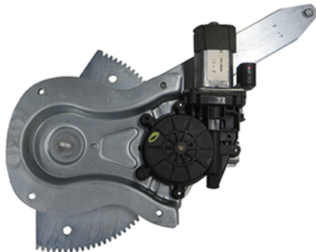
POWER WINDOW RIGHT ALZACRISTALLI ELETTRICO DX

THIS INSTALLATION INSTRUCTION IS FOR BOTH LEFT AND RIGHT SIDE. CETTE INSTRUCTION DE MONTAGE EST POUR LES DEUX COTES DROIT ET GAUCHE. DIESE MONTAGE-ANLEITUNG IST FÜR DIE BEIDE LINKE UND RECHTE SEITE. ESTA INSTRUCCION DE MONTAJE ES PARA LOS DOS LADOS IZQUIERDO Y DERECHO. ESTAS INSTRUÇÕES VALEM TANTO PARA O LADO ESQUERDO QUANTO PARA O DIREITO. LA PRESENTE ISTRUZIONE VALE SIA PER IL LATO SINISTRO CHE PER IL LATO DESTRO.