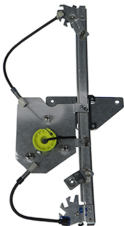
POWER WINDOW LEFT ALZACRISTALLI ELEGTRICO SX

THIS INSTALLATION INSTRUCTION IS FOR BOTH LEFT AND RIGHT SIDE. CETTE INSTRUCTION DE MONTAGE EST POUR LES DEUX COTES DROIT ET GAUCHE. DIESE MONTAGE-ANLEITUNG IST FÜR DIE BEIDE LINKE UND RECHTE SEITE. ESTA INSTRUCCION DE MONTAJE ES PARA LOS DOS LADOS IZQUIERDO Y DERECHO. AS PRESENTES INSTRUÇÕES VALEM TANTO PARA O LADO ESQUERDO QUANTO PARA O DIREITO. DEZE INSTRUCTIE IS GELDIG VOOR ZOWEL DE LINKERKANT ALS DE RECHTERKANT. ΑΥΤΗ Η ΟΔΗΓΙΑ ΕΧΕΙ ΚΑΙ ΤΗΝ ΑΡΙΣΤΕΡΗ ΠΛΕΥΡΑ ΚΑΙ ΤΗΝ ΣΩΣΤΗ ΠΛΕΥΡΑ. LA PRESENTE ISTRUZIONE VALE SIA PER IL LATO SINISTRO CHE PER IL LATO DESTRO.