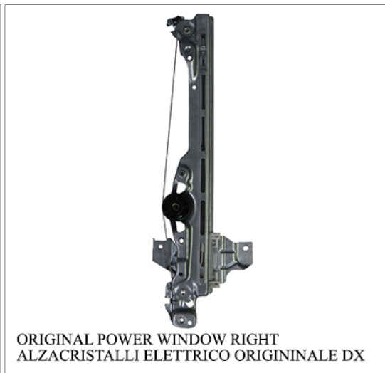
ORIGINAL POWER WINDOW RIGHT ALZACRISTALLI ELETTRICO ORIGINIALE DX