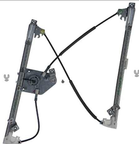
POWER WINDOW RIGHT ALZACRISTALLI ELETTRICO DX

LA PRESENTE ISTRUZIONE VALE SIA PER IL LATO SINISTRO CHE PER IL LATO DESTRO.