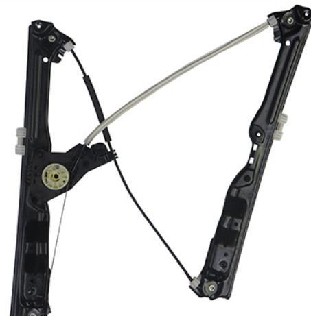
ORIGINAL POWER WINDOW RIGHT ALZACRISTALLI ELETTRICO ORIGINALE DX