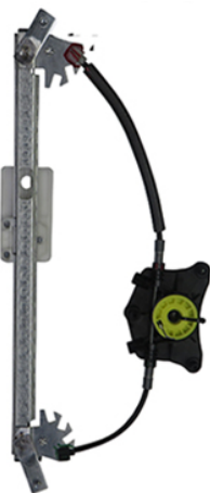
POWER WONDOW LEFT ALZACRISTALLI ELETTRICO SX

THIS INSTALLATION INSTRUCTION IS FOR BOTH LEFT AND RIGHT SIDE. CETTE INSTRUCTION DE MONTAGE EST POUR LES DEUX COTES DROIT ET GAUCHE. DIESE MONTAGE-ANLEITUNG IST FÜR DIE BEIDE LINKE UND RECHTE SEITE. ESTA INSTRUCCION DE MONTAJE ES PARA LOS DOS LADOS IZQUIERDO Y DERECHO. ESTAS INSTRUÇÕES VALEM TANTO PARA O LADO ESQUERDO QUANTO PARA O DIREITO. LA PRESENTE ISTRUZIONE VALE SIA PER IL LATO SINISTRO CHE PER IL LATO DESTRO.