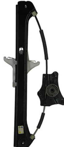
ORIGINAL POWER WIDOW LEFT ALZACRISTALLI ELETTRICO ORIGINALE SX