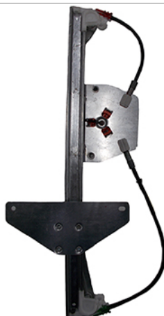
POWER WINDOW RIGHT ALZACRISTALLI ELETTRICO DESTRO

THIS INSTALLATION INSTRUCTION IS FOR BOTH LEFT AND RIGHT SIDE. CETTE INSTRUCTION DE MONTAGE EST POUR LES DEUX COTES DROIT ET GAUCHE. DIESE MONTAGE-ANLEITUNG IST FÜR DIE BEIDE LINKE UND RECHTE SEITE. ESTA INSTRUCCION DE MONTAJE ES PARA LOS DOS LADOS IZQUIERDO Y DERECHO. ESTAS INSTRUÇÕES VALEM TANTO PARA O LADO ESQUERDO QUANTO PARA O DIREITO. LA PRESENTE ISTRUZIONE VALE SIA PER IL LATO SINISTRO CHE PER IL LATO DESTRO.