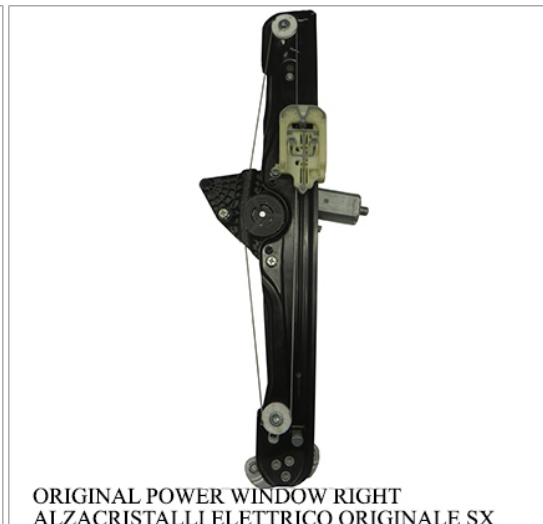
ORIGINAL POWER WINDOW RIGHT ALZACRISTALLI ELETTRICO ORIGINALE SX