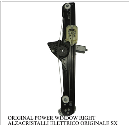
ORIGINAL POWER WINDOW RIGHT ALZACRISTALLI ELETTRICO ORIGINALE SX