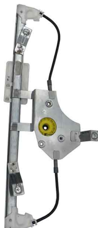
POWER WINDOW LEFT ALZACRISTALLI ELETTRICO SINISTRO

THIS INSTALLATION INSTRUCTION IS FOR BOTH LEFT AND RIGHT SIDE. CETTE INSTRUCTION DE MONTAGE EST POUR LES DEUX COTES DROIT ET GAUCHE. DIESE MONTAGE-ANLEITUNG IST FÜR DIE BEIDE LINKE UND RECHTE SEITE. ESTA INSTRUCCION DE MONTAJE ES PARA LOS DOS LADOS IZQUIERDO Y DERECHO. ESTAS INSTRUÇÕES VALEM TANTO PARA O LADO ESQUERDO QUANTO PARA O DIREITO. DEZE AANWIJZINGEN GELDEN VOOR ZOWEL DE LINKER- ALS DE RECHTERKANT. Η ΠΑΡΟΥΣΑ ΟΔΗΓΙΑ ΑΦΟΡΑ ΤΟΣΟ ΤΗΝ ΑΡΙΣΤΕΡΗ ΟΣΟ ΚΑΙ ΤΗ ΔΕΞΙΑ ΠΛΕΥΡΑ. LA PRESENTE ISTRUZIONE VALE SIA PER IL LATO SINISTRO CHE PER IL LATO DESTRO.