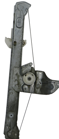
ORIGINAL POWER WINDOW LEFT ALZACRISTALLO ELETTRICO ORIGINALE SX