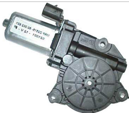
MOTOR LEFT MOTORE SX

THIS INSTALLATION INSTRUCTION IS FOR BOTH LEFT AND RIGHT SIDE. CETTE INSTRUCTION DE MONTAGE EST POUR LES DEUX COTES DROIT ET GAUCHE. DIESE MONTAGE-ANLEITUNG IST FÜR DIE BEIDE LINKE UND RECHTE SEITE. ESTA INSTRUCCION DE MONTAJE ES PARA LOS DOS LADOS IZQUIERDO Y DERECHO. ESTAS INSTRUÇÕES VALEM TANTO PARA O LADO ESQUERDO QUANTO PARA O DIREITO. DEZE AANWIJZINGEN GELDEN VOOR ZOWEL DE LINKER- ALS DE RECHTERKANT. Η ΠΑΡΟΥΣΑ ΟΔΗΓΙΑ ΑΦΟΡΑ ΤΟΣΟ ΤΗΝ ΑΡΙΣΤΕΡΗ ΟΣΟ ΚΑΙ ΤΗ ΔΕΞΙΑ ΠΛΕΥΡΑ. LA PRESENTE ISTRUZIONE VALE SIA PER IL LATO SINISTRO CHE PER IL LATO DESTRO.