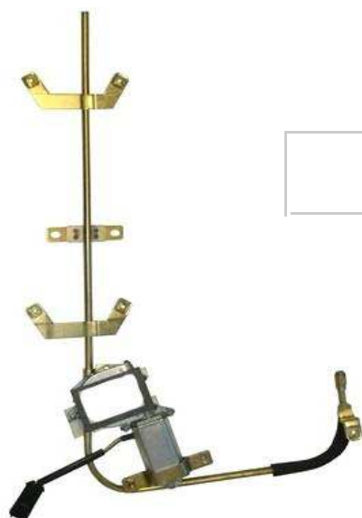
Ns alzacristallo SX Our power window left

segue MERCEDES G (W460 - W461 - W463) -> 2000