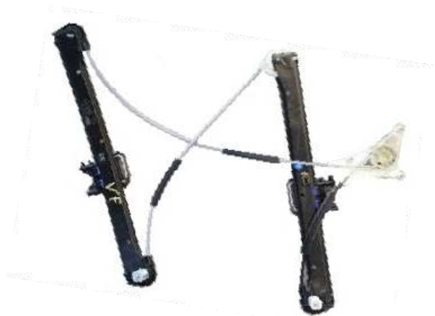
Ns meccanismo SX