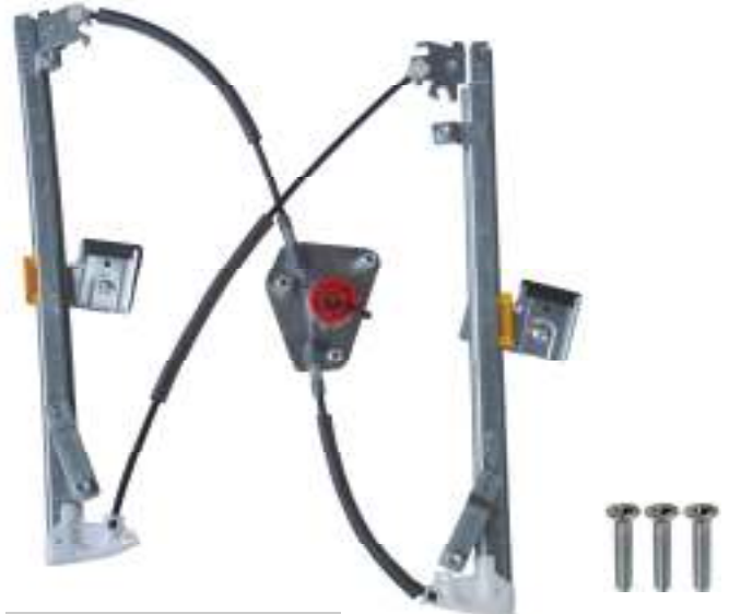
Ns meccanismo SX