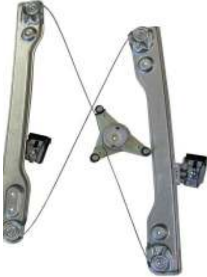
Meccanismo originale SX

SOLO MECCANISMO da montare esclusivamente su pannelli "made in South Corea" MECHANISM ONLY to be mounted only on panels "made in South Corea" MECANISME pour être monté uniquement sur des panneaux "made in South Corea"