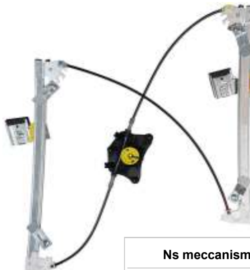
Ns meccanismo DX