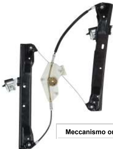
Meccanismo originale DX

SOLO MECCANISMO MECHANISM ONLY MECANISME (PAS DE MOTEUR)