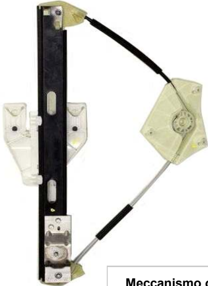
Meccanismo originale SX

SOLO MECCANISMO MECHANISM ONLY MECANISME (PAS DE MOTEUR)