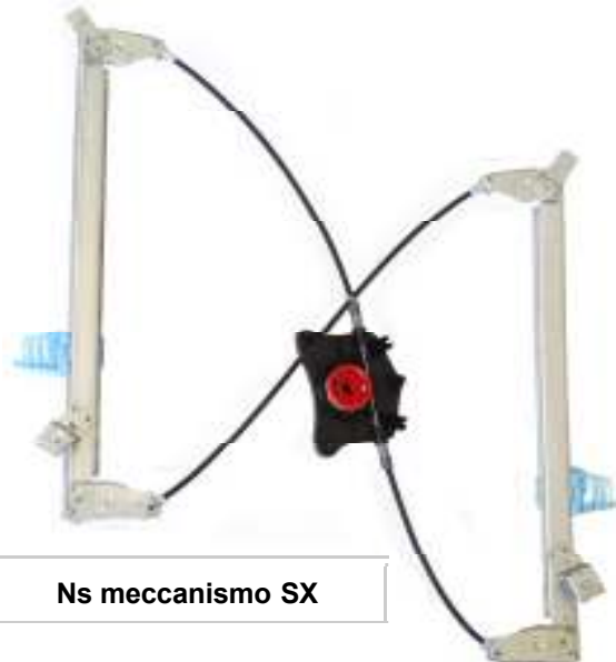
Ns meccanismo SX