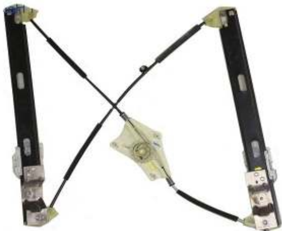
Meccanismo originale SX

SOLO MECCANISMO MECHANISM ONLY MECANISME (PAS DE MOTEUR)