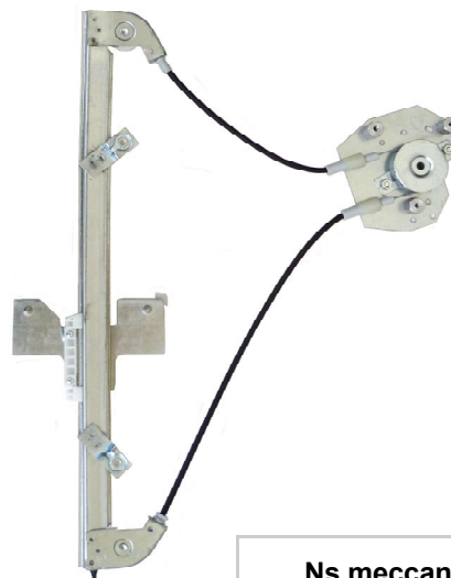
Ns meccanismo SX