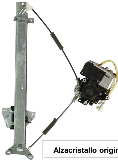
Alzacristallo originale SX

SOLO MECCANISMO MECHANISM ONLY MECANISME (PAS DE MOTEUR)