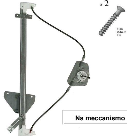
Ns meccanismo SX