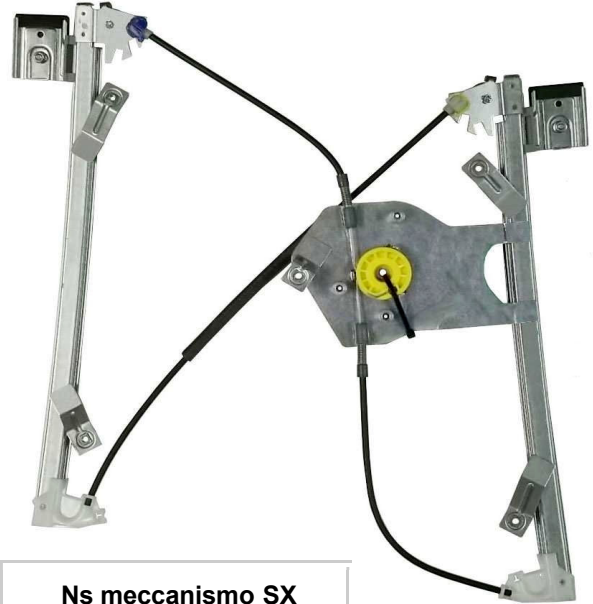
Ns meccanismo SX