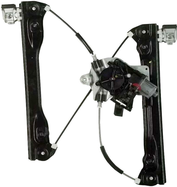
Alzacristallo originale SX

SOLO MECCANISMO MECHANISM ONLY MECANISME (PAS DE MOTEUR)