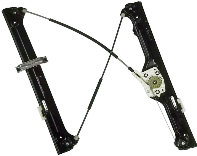
Meccanismo originale SX

SOLO MECCANISMO MECHANISM ONLY MECANISME (PAS DE MOTEUR)