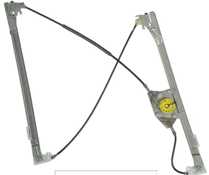
Ns meccanismo SX