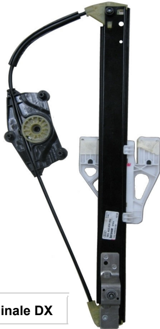
Meccanismo originale DX

SOLO MECCANISMO MECHANISM ONLY MECANISME (PAS DE MOTEUR)