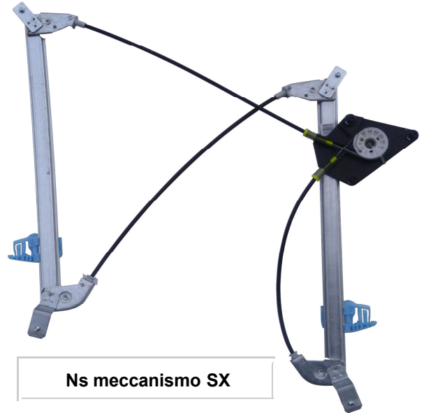
Ns meccanismo SX