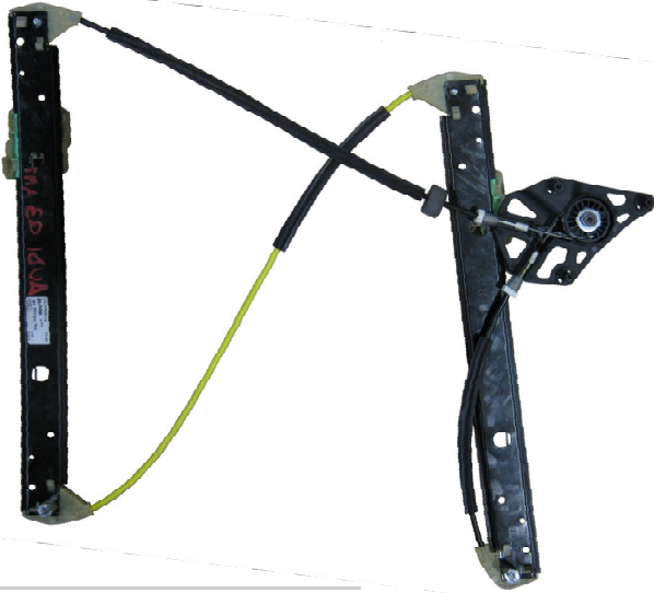
Meccanismo originale SX

SOLO MECCANISMO MECHANISM ONLY MECANISME (PAS DE MOTEUR)