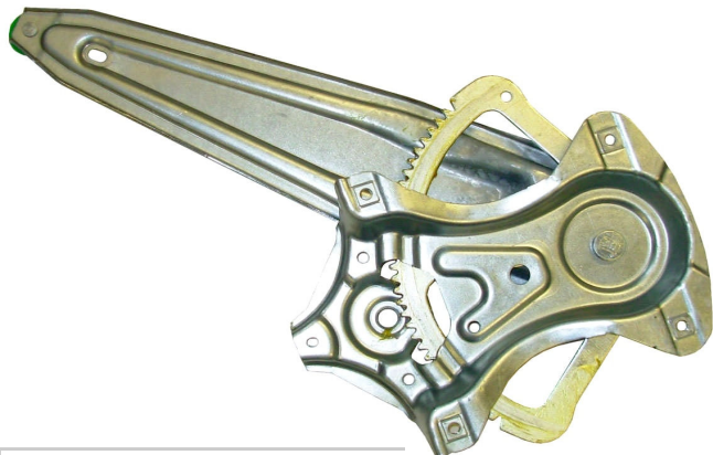
Meccanismo originale SX

SOLO MECCANISMO MECHANISM ONLY MECANISME (PAS DE MOTEUR)