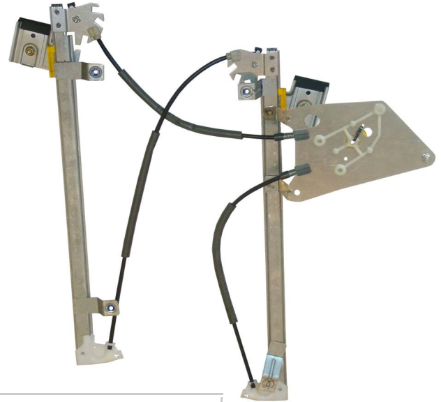
Ns meccanismo SX