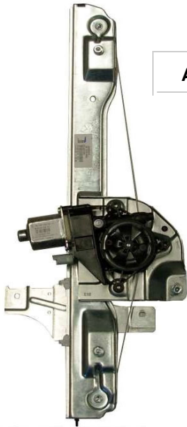
Alzacristallo originale SX

SOLO MECCANISMO MECHANISM ONLY MECANISME (PAS DE MOTEUR)