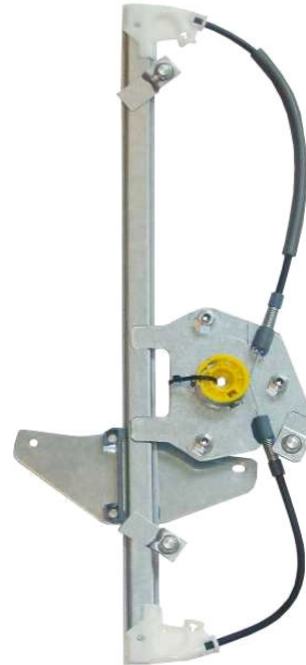
Ns meccanismo SX