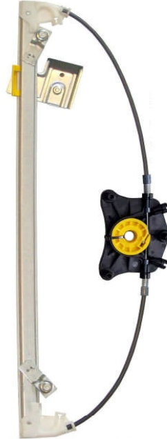
Ns meccanismo SX