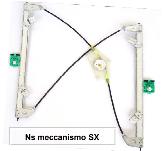
Ns meccanismo SX