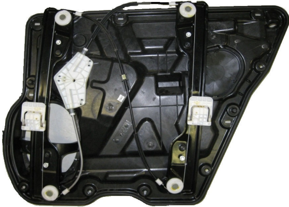
Meccanismo originale SX con pannello

SOLO MECCANISMO (NO PANNELLO) MECHANISM ONLY (NO PANEL) MECANISME (PAS DE PANNEAU)