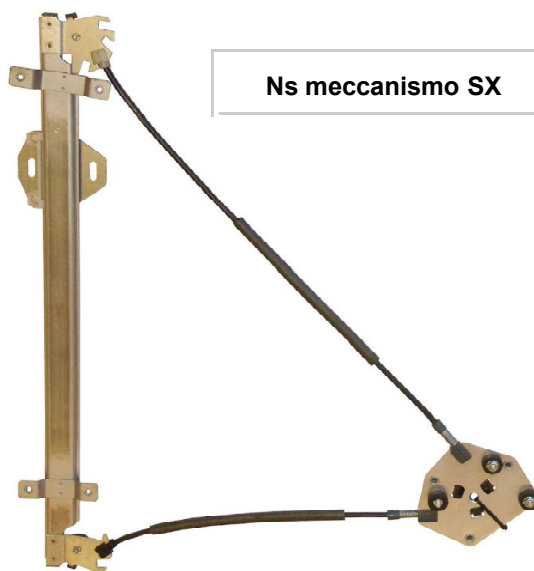
Ns meccanismo SX