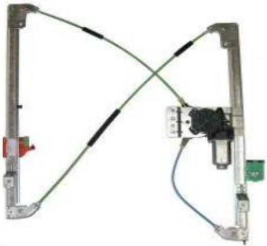
ALZACRISTALLO ELETTRICO ORIGINALE SINISTRO ORIGINAL POWER WINDOW LEFT