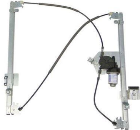
ALZACRISTALLO ELETTRICO SINISTRO POWER WINDOW LEFT

Accessori in dotazione per il montaggio - Supplied accessories for mounting - Accessoires fournis pour le montage - Montagezubehör enthalte - Se suministran componentes para el montaj - Acessórios de montagem - Εξαρτήματα για εγκατάσταση - Załączone akcesoria do montażu