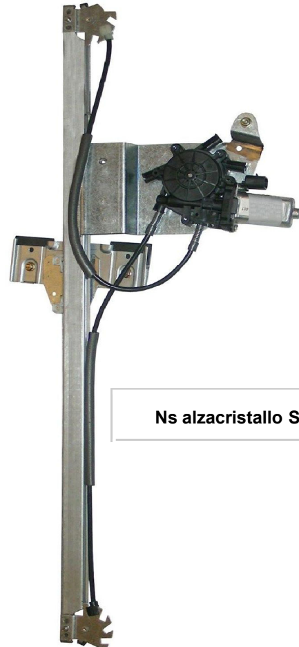
Ns alzacristallo SX