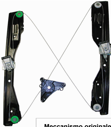
Meccanismo originale SX

SOLO MECCANISMO MECHANISM ONLY MECANISME (PAS DE MOTEUR)