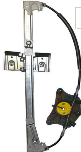
Ns meccanismo SX