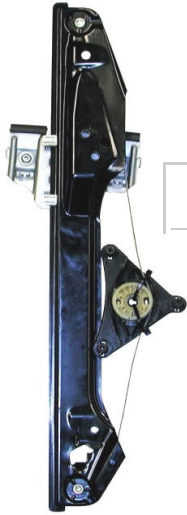
Meccanismo originale SX

SOLO MECCANISMO MECHANISM ONLY MECANISME (PAS DE MOTEUR)