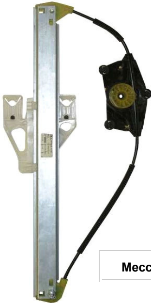
Meccanismo originale SX

SOLO MECCANISMO MECHANISM ONLY MECANISME (PAS DE MOTEUR)