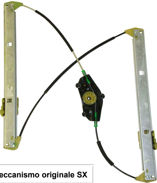
Meccanismo originale SX

SOLO MECCANISMO MECHANISM ONLY MECANISME (PAS DE MOTEUR)