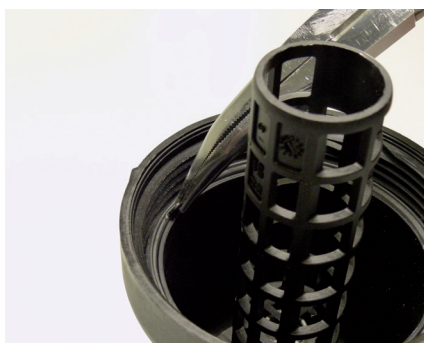
Figure 2 : La languette aide à retirer l'ancien joint