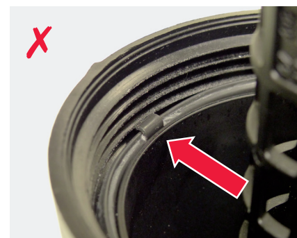
Figure 4 : Languette coincée dans le filetage

IMPORTANT ! Les joints doivent toujours être lubrifiés avec de l'huile propre avant le montage pour éviter tout dommage ou fuite. De plus, un couple de serrage trop élevé peut également causer une perte d'huile au niveau du carter de filtre. Il est donc absolument nécessaire de respecter les consignes du fabricant !