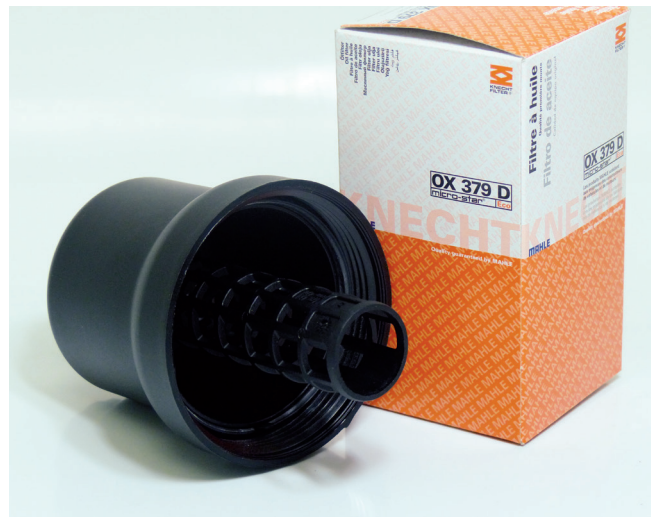
Figure 1 : Cartouche de filtre à huile avec couvercle de carter démonté

Lors du montage du joint pour les cartouches citées, il faut également veiller à ce que la languette soit dirigée vers le haut et qu'elle soit visible dans le couvercle (figure 3). Un joint monté à l'envers ou une languette coincée dans le filetage (figure 4) entraînent une perte d'huile au niveau du couvercle du filtre.