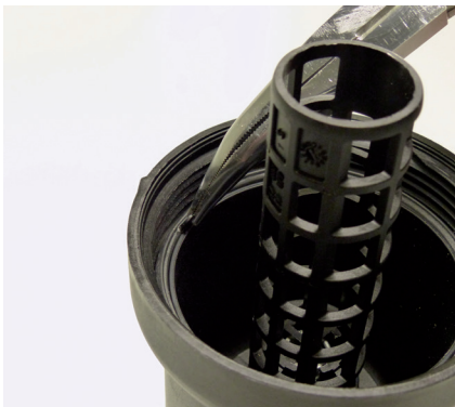
Abbildung 2: Die Lasche dient als Hilfe zum Entfernen der alten Dichtung