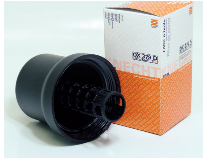
Abbildung 1: Ölfilter-Einsatz mit demontiertem Gehäusedeckel

Bei den Dichtungen der genannten Filter-Einsätze ist zudem darauf zu achten, dass die Lasche nach oben zeigt und im Deckel sichtbar ist (siehe Abbildung 3). Wird die Dichtung falsch herum verbaut oder die Lasche verklemt sich im Gewinde (siehe Abbildung 4), kommt es zum Ölaustritt am Filterdeckel.